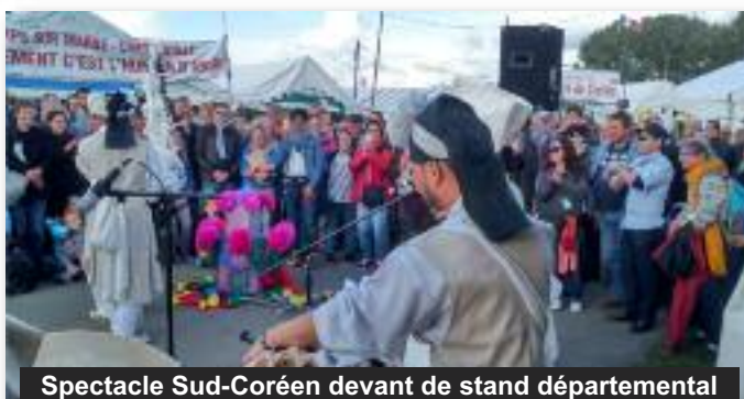
Spectacle Sud-Coréen devant de stand départemental

Nous pouvons nous appuyer sur eux pour suivre et amplifier les mobilisations contre la politique libérale et droitière de Macron et ouvrir l'espoir. Les résultats des élections présidentielles et législatives de 2017 nous poussent à repenser l'action du PCF. Il nous faut être audacieux et offensifs pour être à la hauteur des défis qui sont