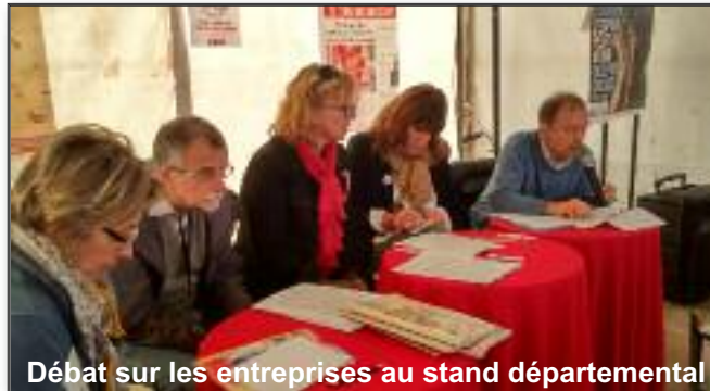
Débat sur les entreprises au stand départemental

Le défi est grand mais nous ne partons pas de rien. Le PCF est riche d'idées, d'énergies humaines, de convictions fortes portées par des militants ancrés dans la réalité des luttes au quotidien.